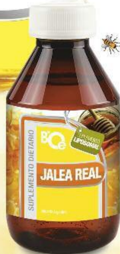
Jalea Real Suplemento Liposomal

Estimula el sistema inmunológico. Aporta energía. Disminuye la fatiga, incrementa la resistencia física y mental. Mejora el rendimiento sexual. Regula el aparato digestivo. Es un regenerador celular que retrasa el envejecimiento.